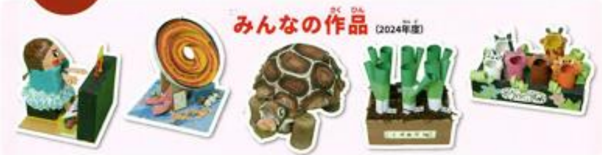
みんなの作品 (2024年度)