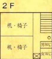
[3号舎] (プレハブ校舎)