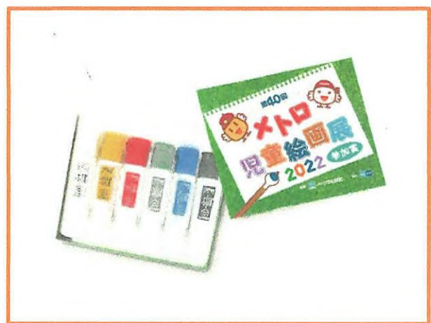
参加賞(オリジナル絵の具)